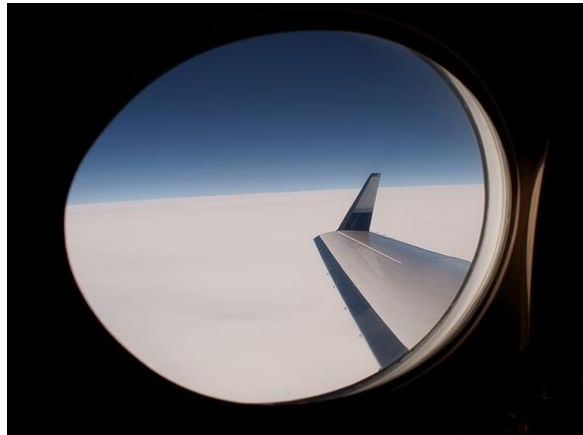
Janelas grandes e ovais para melhor visibilidade e iluminação